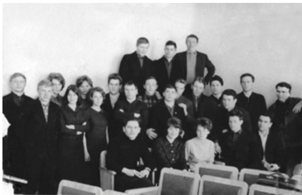
Студенты гр. АПП-64-1-2 в учебной аудитории