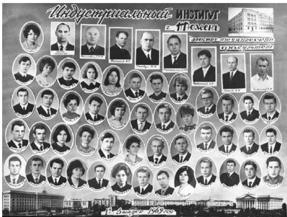
Выпускники 1969 г. электротехнического факультета по специальности «Автоматизация производственных процессов»

Приходилось отвлекаться от строительства ЛЭП и потому, что приходили баржи с продуктами, строительными материалами, оборудованием. Тогда это все в избытке завозилось в нефтяные районы. Мешки с цементом, мукой по 50–60 кг на плечах с баржи поднимали по песчаному берегу, грузили на ГТС (гусеничный тягач средний), затем снова на плечах заносили и складывали на базе. Смогу ли сейчас несколько раз подняться на тот высокий песчаный берег даже с пустым мешком?.. Один раз, наверное, не подведу!